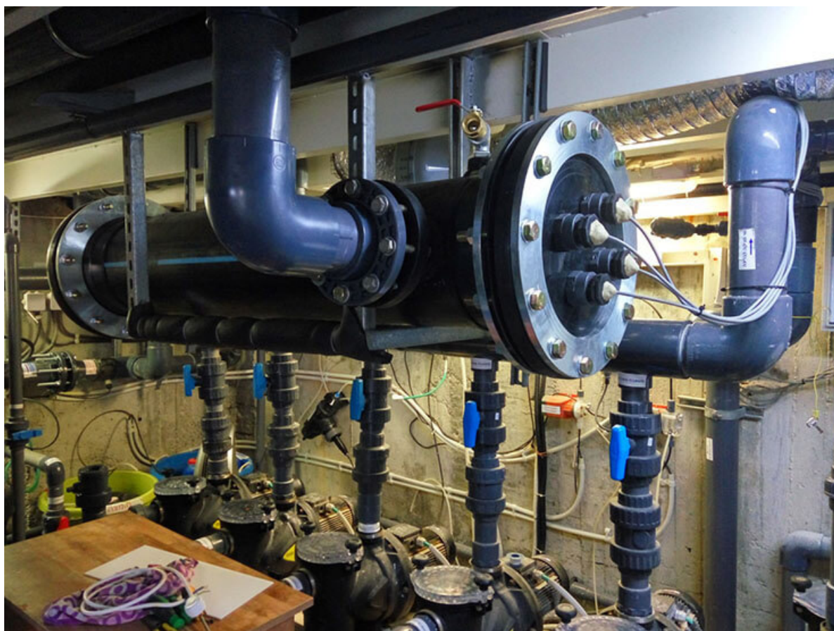
מערכת שפיתחה חברת אקוטופ.