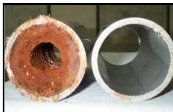
צינור מים חמים משקים